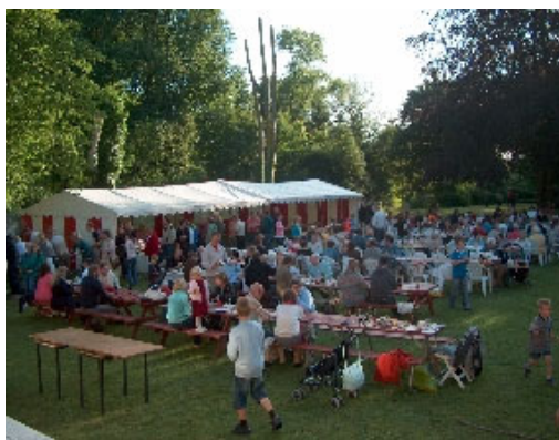
Skt. Hans-stemning i præstegårdshaven 2006.