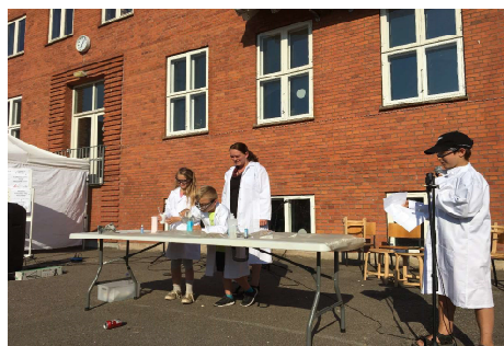
Markedsdag på Kildeskolen 2018