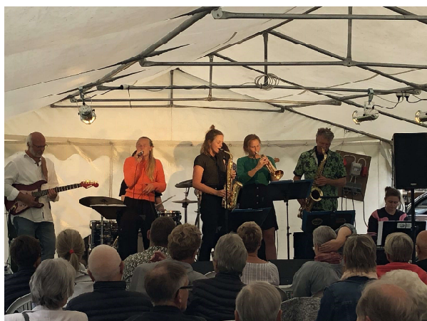
Jazz i præstegårdshaven, 2019